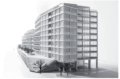
B:HUB Berlin am Ostkreuz