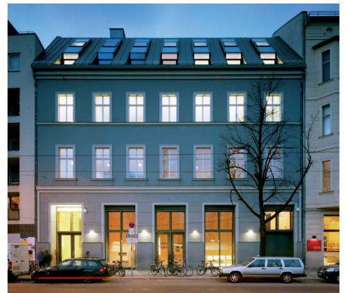
Galerie Sprüth Magers