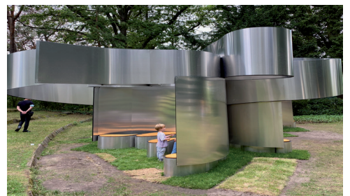
Garten Haus am Waldsee