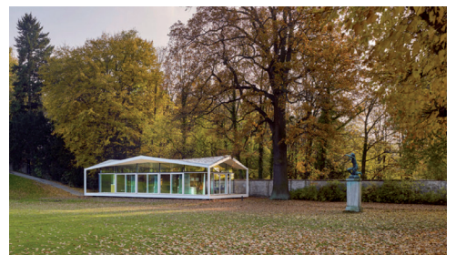
Pavillon der Fellows der American Academy